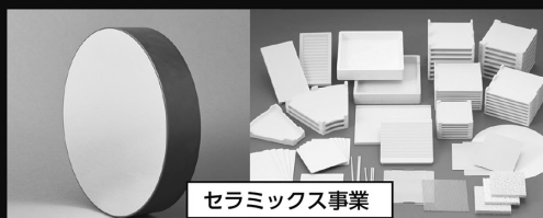
セラミックス事業