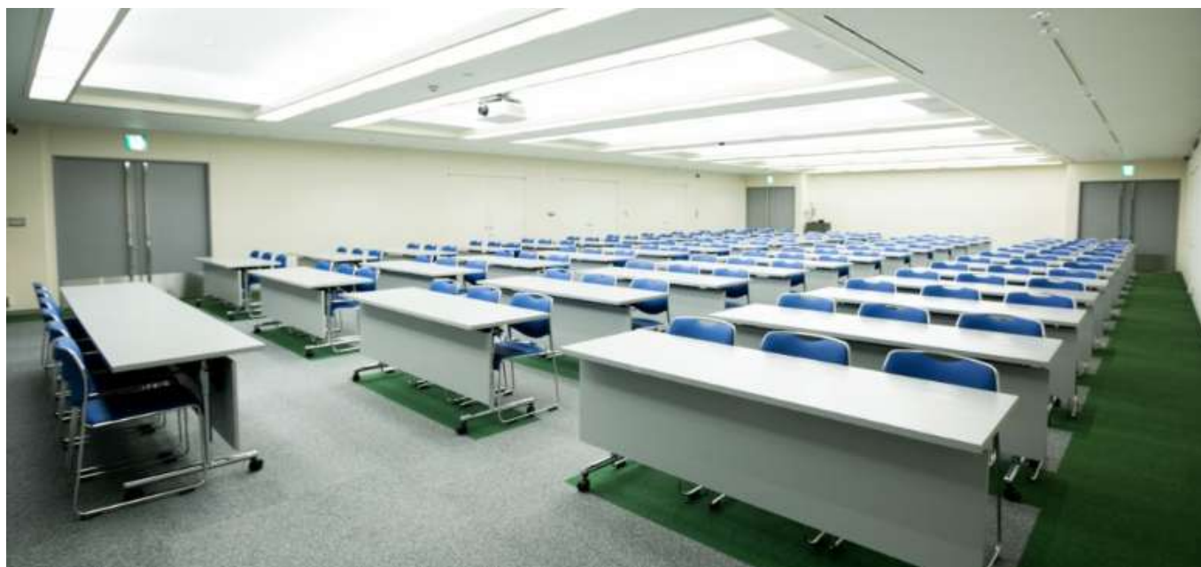
【502 会議室;理事会 & 講演会】