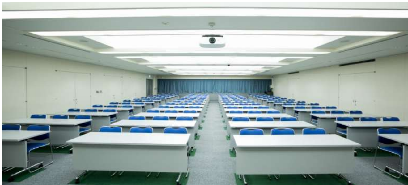
【501 会議室;総会 & 講演会】